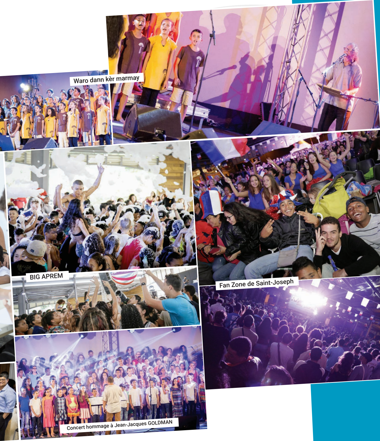
Waro dann kèr marmay