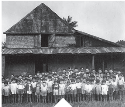
École de La Plaine-Des-Grègues en 1933