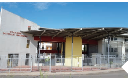
Le Collège Achille GRONDIN 2009

De 1989 à 2016, l'Education nationale a implanté un peu plus de 700 postes d'enseignants dans la commune.