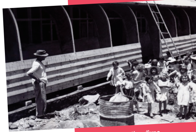
Construction d'une classe Eclair

La rentrée 1961 voit l'ouverture de 23 classes nouvelles. (locations de maisons particulières, classes « Eclair » et « Météor »). La Réunion recrute tant bien que mal 400 instituteurs par an.