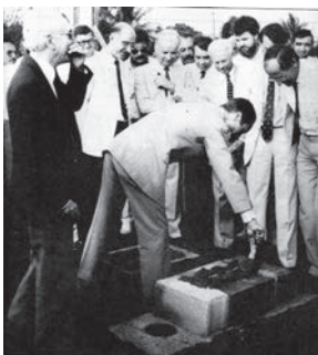
Vers 1985, pose de la 1ère pierre du Lycée Professionnel

La poursuite de la scolarisation secondaire nécessite la création de lycées. Entre 1965 et 1987, le seul lycée du Sud a été celui du Tampon. Les lycéens de Saint-Joseph devaient se lever avant le soleil pour rentrer chez eux souvent après son coucher. En fait, seuls ceux du centre-ville pouvaient suivre une scolarité dans les meilleures conditions.