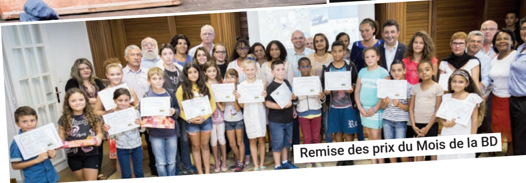
Remise des prix du Mois de la BD