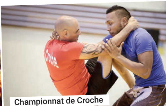
Championnat de Croche