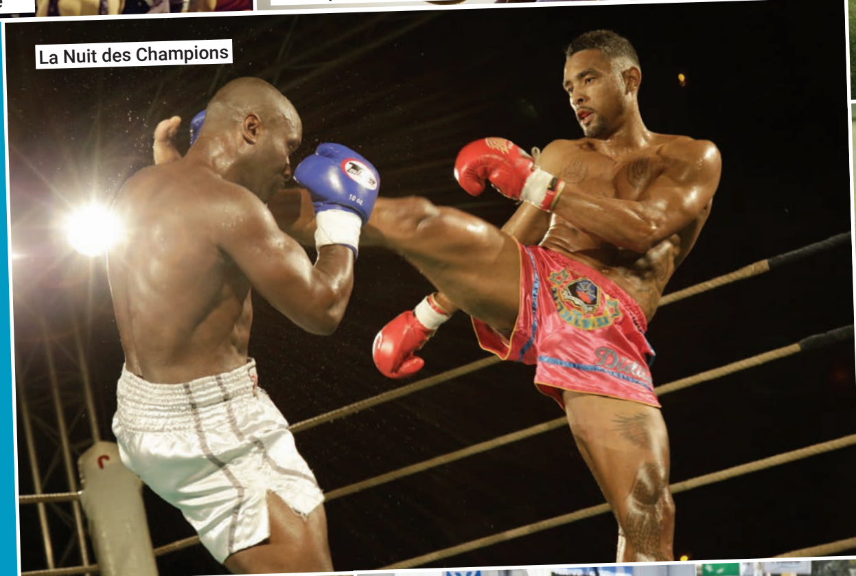
La Nuit des Champions