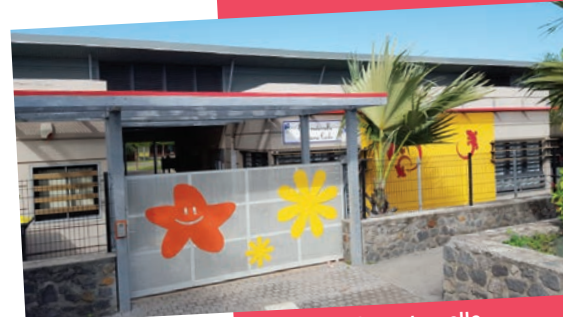
Ecole maternelle Mme CARLO 2012

5092 élèves dans 25 écoles 2596 élèves dans 3 collèges 2782 élèves dans 4 lycées