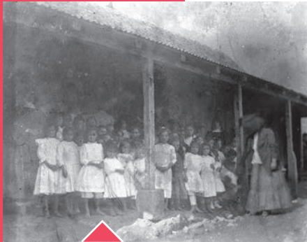
École des Sœurs 1911

De la laïcisation effective de l'école vers 1911 à la Départementalisation, l'école à Saint-Joseph a peu évolué. Locaux vétustes et inadaptés, classes pléthoriques avec une moyenne de 57 élèves par classe. La commune affiche un taux de scolarisation d'à peine 40% avec un fort taux d'absentéisme. Peu d'enfants vont à l'école après 12 ans.