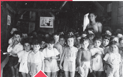
Classe maternelle 1955 Plaine des Grègues On compte plus de trente élèves sur la photo.

L'impulsion donnée par la départementalisation et l'action vigoureuse de Raphaël BABET.