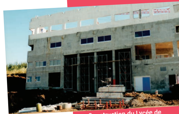
Construction du Lycée de Vincenzo 1998

De 1989 à 2016, l'Education nationale a implanté un peu plus de 700 postes d'enseignants dans la commune.