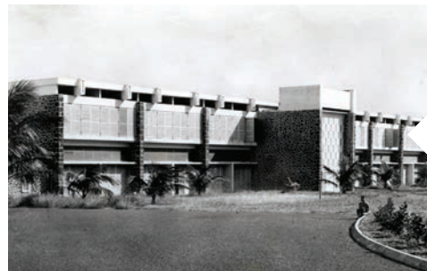
Construction de l'École d'Agriculture 1952-53