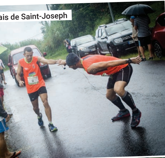
Stade de Saint-Joseph

Stage de Judo avec Larby BENOUDAUD Sélectionneur Équipe de France Féminine