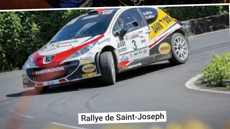
Rallye de Saint-Joseph