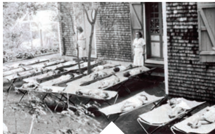
Sieste, Maternelle rue Maury 1954/55