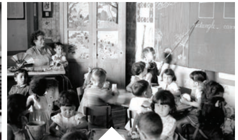
Une maternelle "modèle" avec le premier mobilier tubulaire.