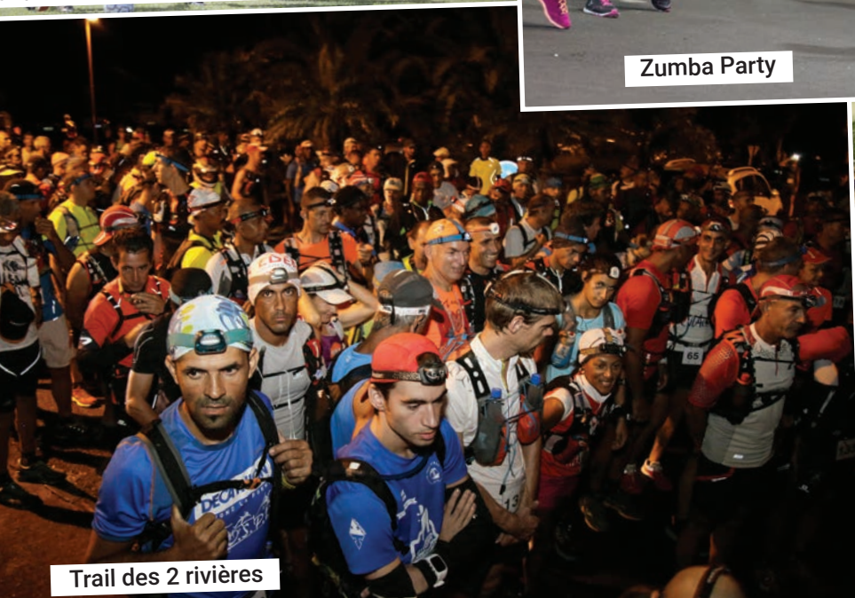
Trail des 2 rivières