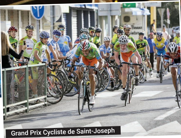
Grand Prix Cycliste de Saint-Joseph