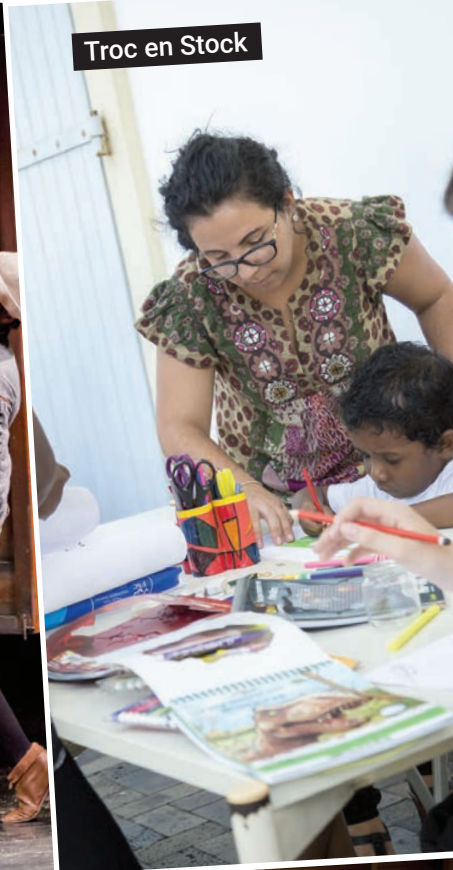
Troc en Stock