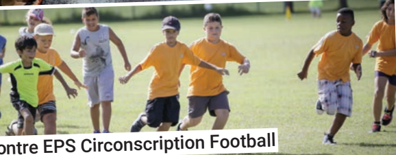
Contre EPS Circonscription Football