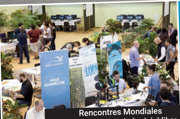
Rencontres Mondiales Décentralisées du logiciel libre