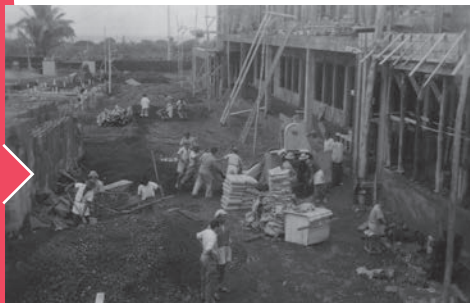
1953-54 Construction du groupe scolaire des garçons.