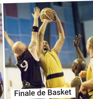
Finale de Basket