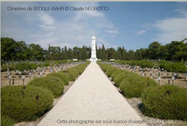
Cimetière de SEDDUL-BAHR

Cette photographie est sous licence d'usage CC BY-NC-SA 2.0