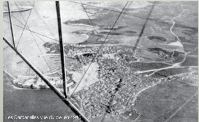
Les Dardanelles vue du ciel en 1915

Sur les 1 200 Saint-Joséphois répertoriés à ce jour qui ont été incorporés pendant la Grande Guerre, 13 l'ont été dans le Corps Expéditionnaire des Dardanelles et 71 dans l'Armée d'Orient à partir de 1917.