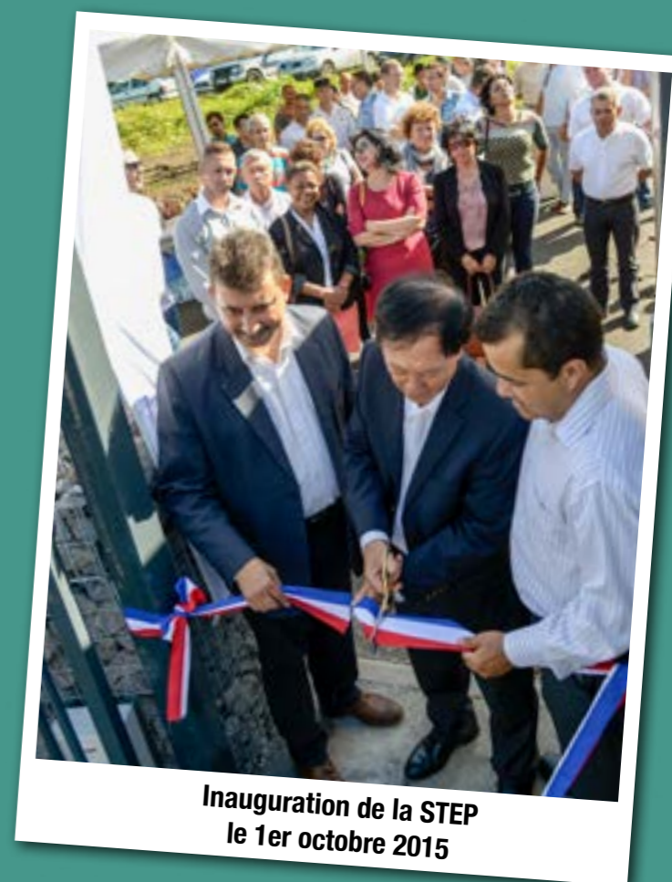
Inauguration de la STEP le 1er octobre 2015

L'originalité de cet équipement réside dans son espace pédagogique destiné à accueillir des scolaires. La salle et le parcours pédagogique permettront aux jeunes Saint-Joséphois de découvrir et comprendre le grand cycle de l'eau et les étapes du traitement des eaux usées avant leur rejet en milieu naturel.