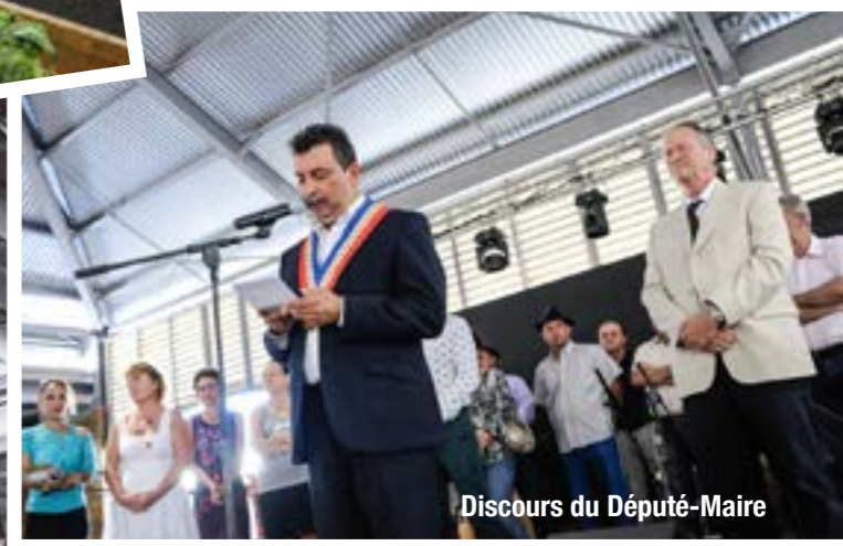
Discours du Député-Maire

Au-delà d'accueillir le marché du sud sauvage tous les vendredis, la halle sera l'un des éléments moteurs de la dynamique économique et culturelle du cœur de ville. Il est envisagé de créer notamment un 2ème jour de marché, mais aussi de développer et de soutenir une politique d'animations événementielles.