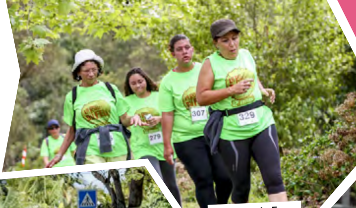
La Route du Feu