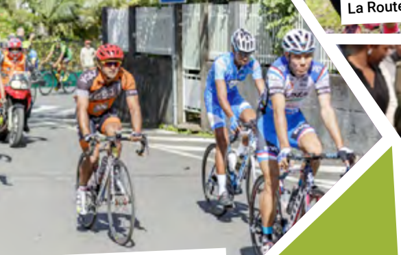
Prix cycliste Stéphane Sidat