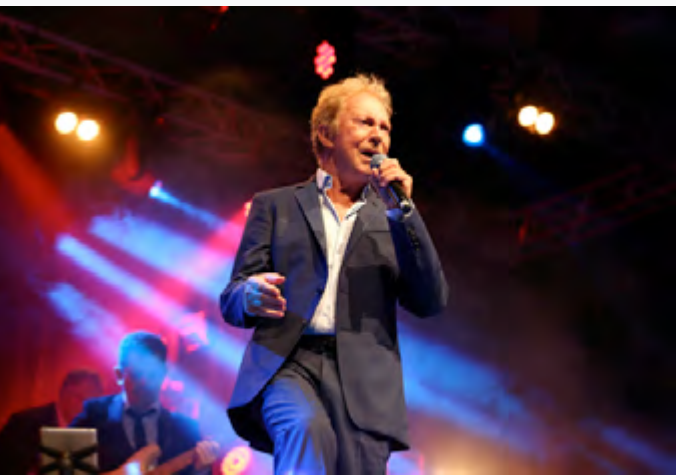
Énorme succès, énorme ambiance pour le concert Années 80. Rendez-vous est pris pour 2018, toujours sous la Halle.