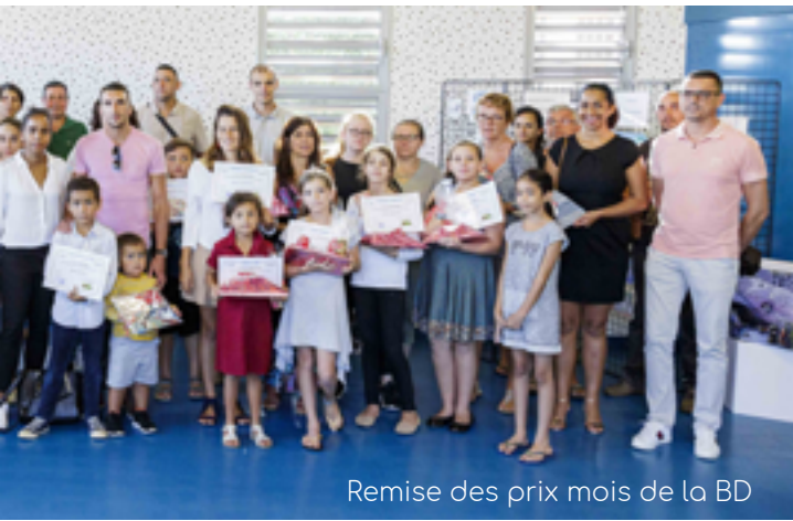
Remise des prix mois de la BD