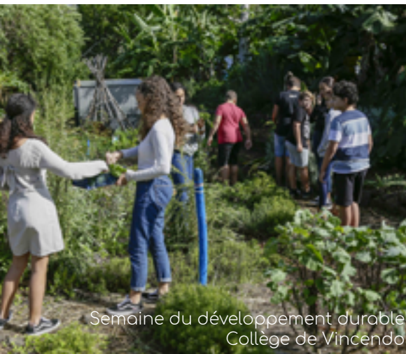
Semaine du développement durable Collège de Vincenzo