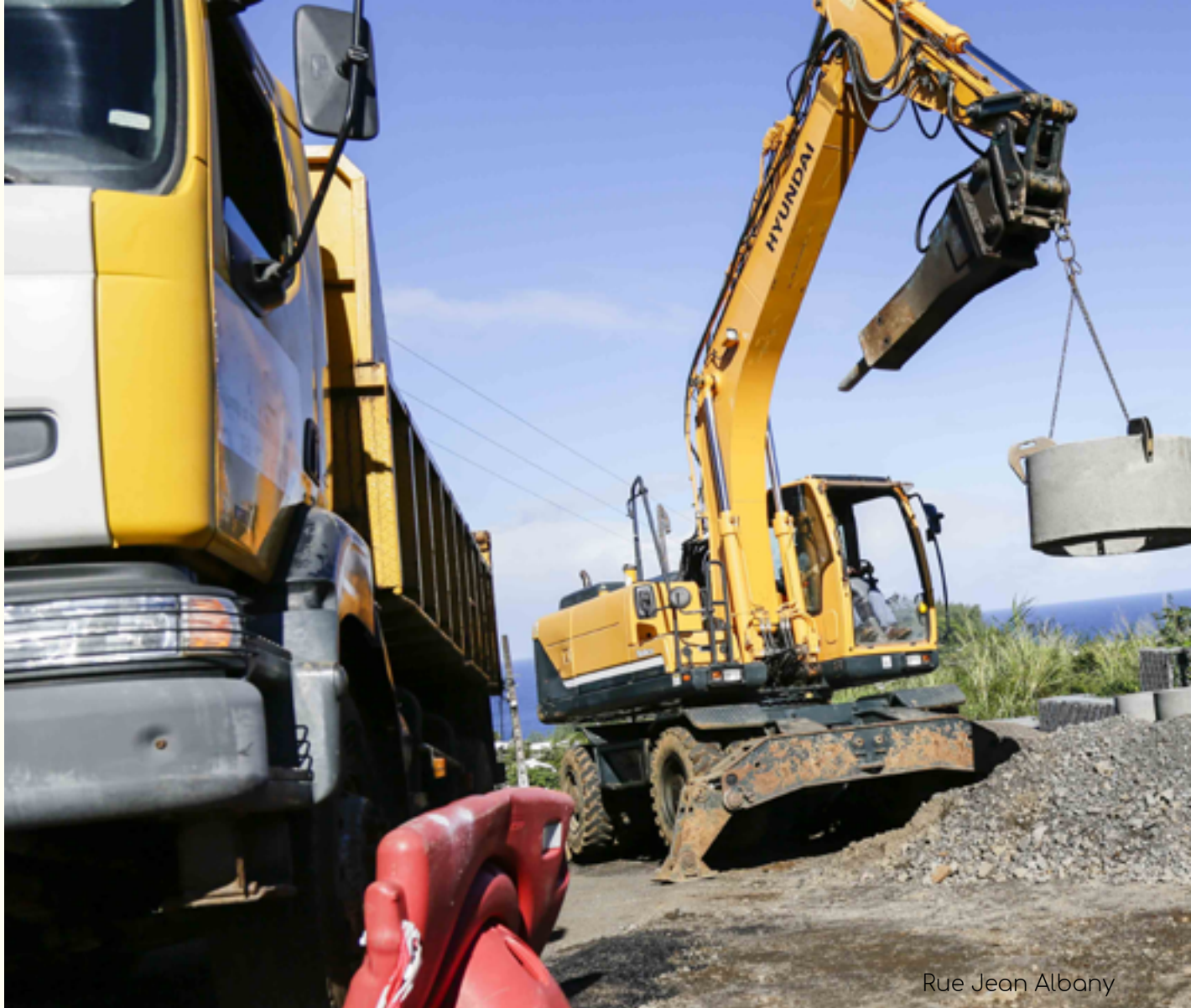
Rue Jean Albany