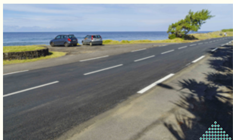
Boulevard Lenepveu et Emile Labonne