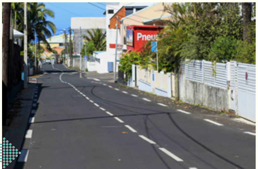
Rue Maréchal Leclerc derrière le stade Raphaël BABET

En matière de remise en état des voiries, 49 chemins sont programmés pour une remise en état. Soit un linéaire de plus de 30 km.