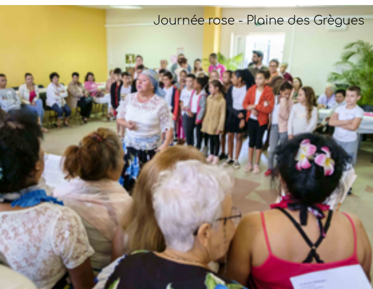
Journée rose - Plaine des Grègues