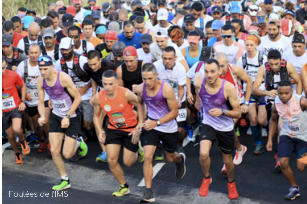
Foulées de l'IMS