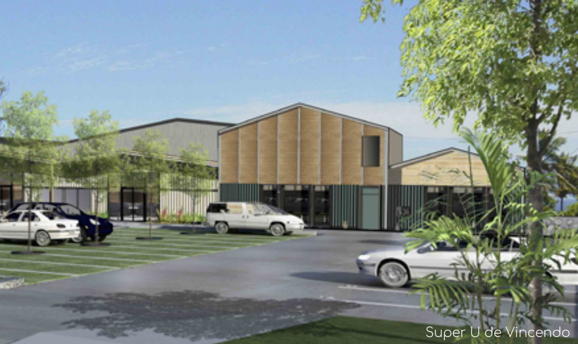
Super U de Vincendo