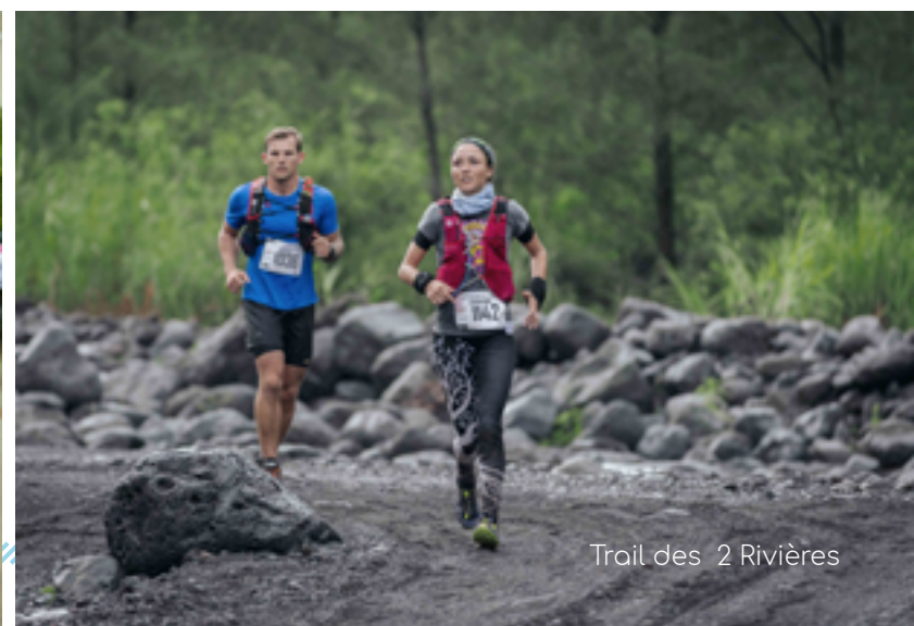
Trail des 2 Rivières