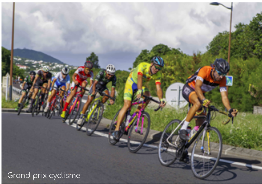
Grand prix cyclisme