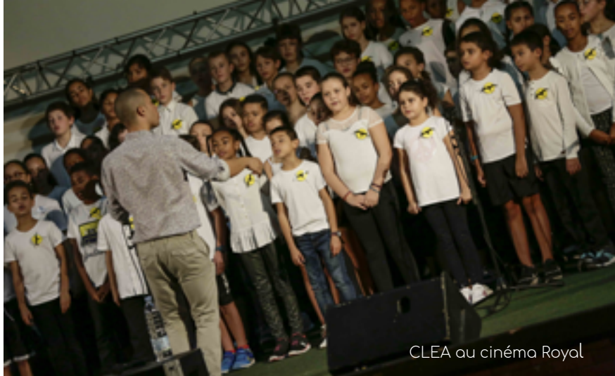
CLEA au cinéma Royal