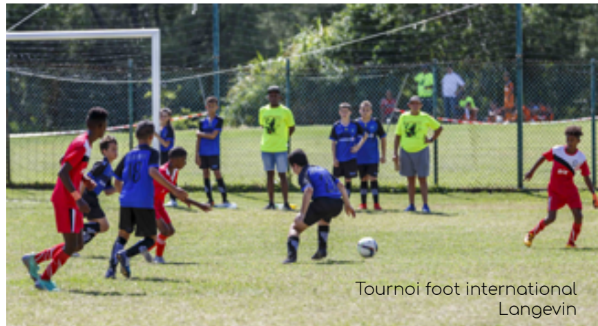
Tournoi foot international Langevin