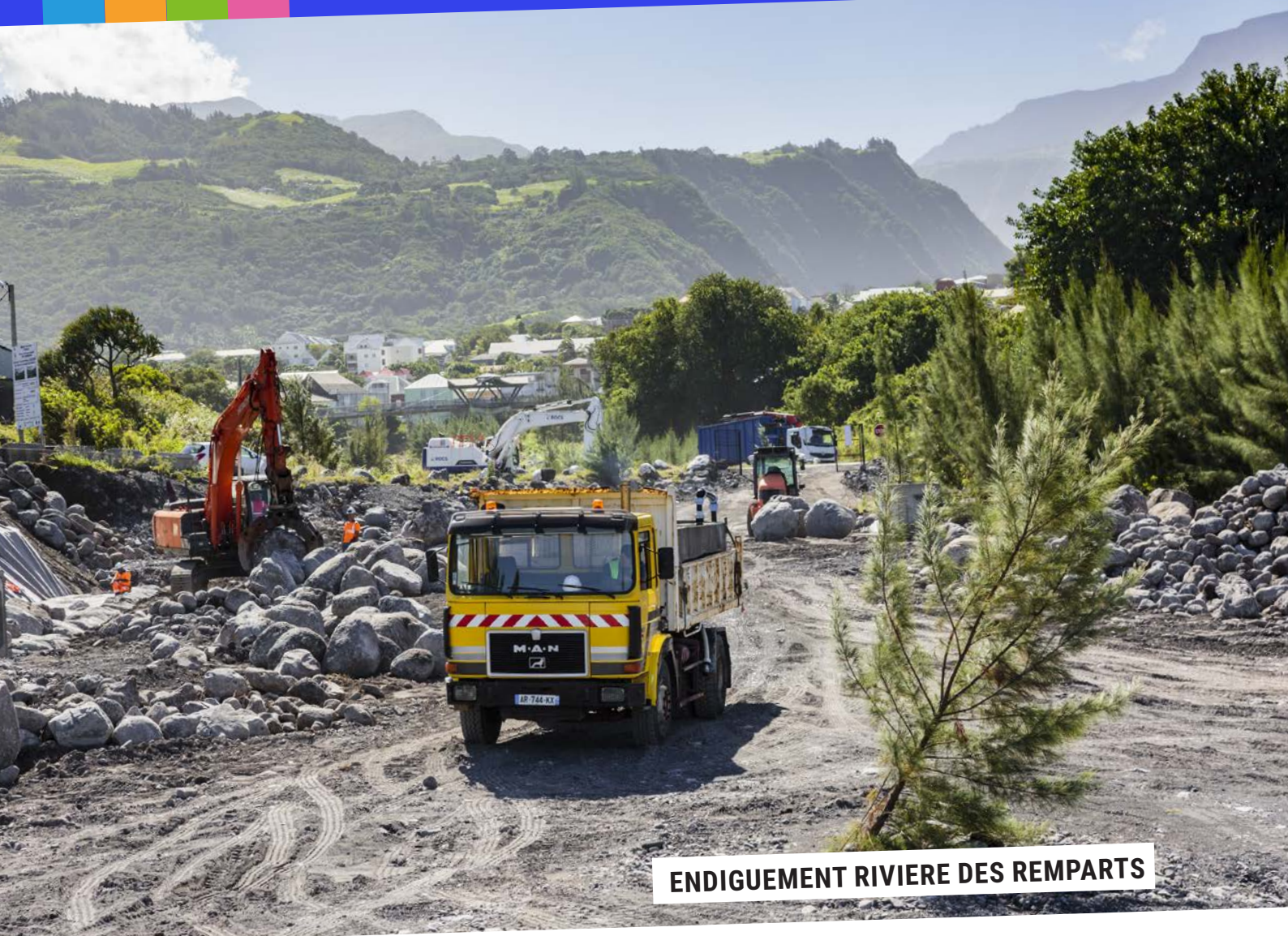
ENDIGUEMENT RIVIERE DES REMPARTS

LE MAGAZINE D'INFORMATION DE LA COMMUNE DE SAINT-JOSEPH