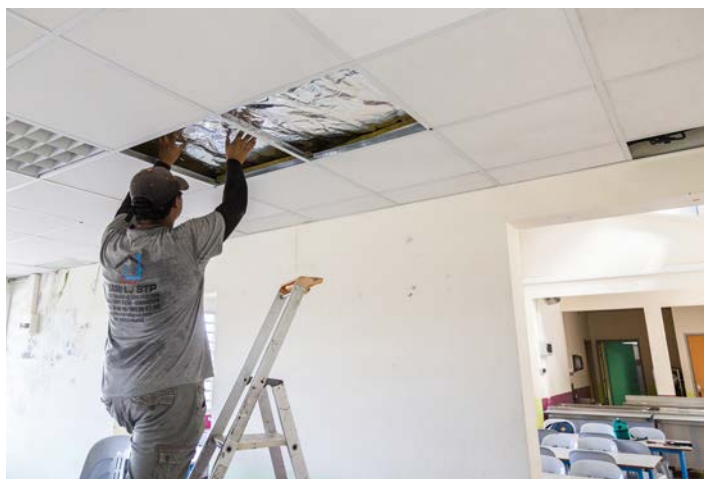
Travaux de confort thermique réalisés à l'école primaire des Jacques

Ces travaux, entièrement financés dans le cadre des CEE, sont réalisés à titre gratuit au profit de la commune.