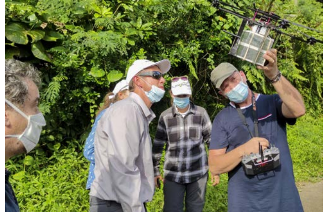
Echantillon moustiques stériles