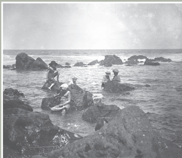
Costumes de bains jusqu'aux mollets, un peu à l'écart des regards indiscrets derrière les rochers. Un bassin quelque peu privé à deux pas de la maison familiale du maire Emile Hoareau.