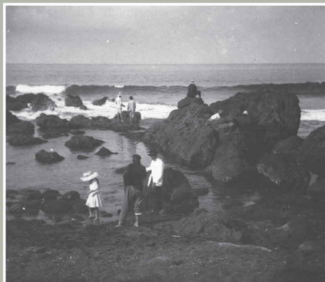
Ces messieurs attendent patiemment le retour des barques de pêche en compagnie de Margot la fille d'Elise.